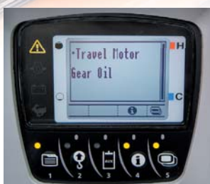
Service interval informatie